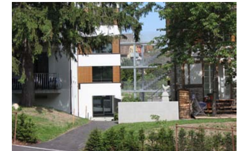
gestockte Mauer im Eingangsbereich